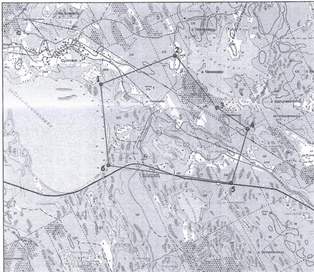
Координаты угловых точек