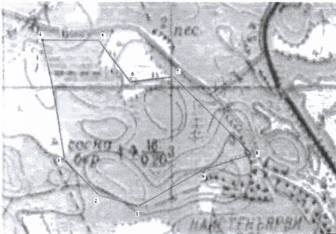
Географические координаты участка недр «Хир»